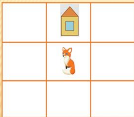
Игра «Помоги зайчику дойти до дома»